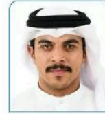
صالح عبدالله سيادي نائب الرئيس