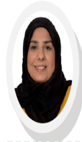
Written By Dr. Hayat Ali Acting Dean of Student Affairs

Using the automated system of grades appealing on SIS, the students can easily apply for grades appealing so then their requests would be processed smoothly by the concerned parties. On the other hand, the clearance process for students to be graduated will be done electronically by the concerned parties without the need of the students to fill the form manually and pass by the different places at the University which will ease the process and provide more efficiency.