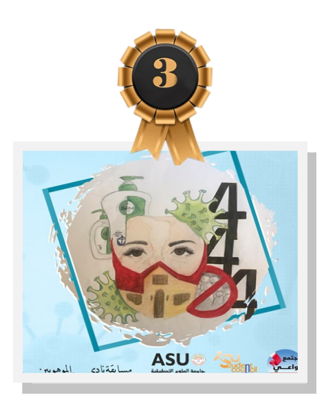
بعض من صور المشاركين: